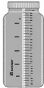
24h-Sammelbehälter (in der Apotheke erhältlich)

Was Sie dafür benötigen: (Behälter müssen nicht steril sein)